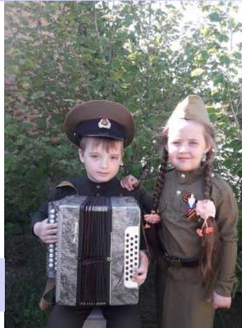
«Я помню! Я горжусь!»