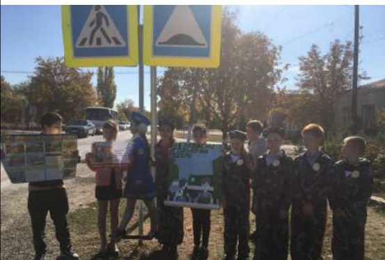
Юные инспектора движения