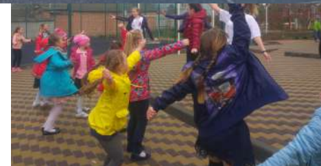
Работа с младшими