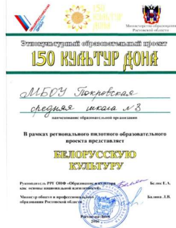
«150 культур Дона»