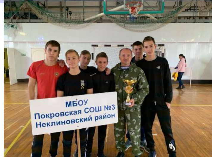
Спартакиада «Смело, с оптимизмом, за здоровый образ жизни.»