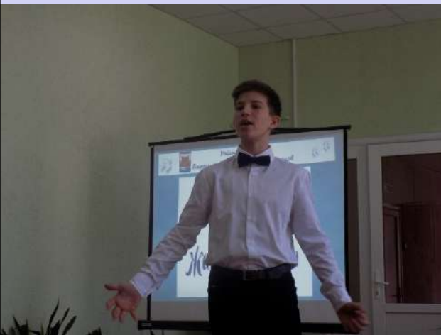
Районный этап всероссийского конкурса чтецов «Живая классика»»