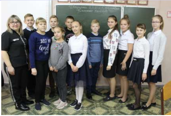
Районный брейн-ринг среди старшекласников